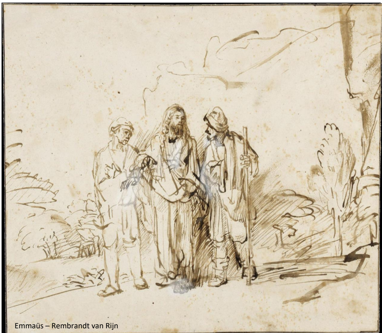
Emmaüs – Rembrandt van Rijn

Deze drievoudige roeping wordt in een prachtig Engelstalig zinnetje uitgedrukt: To love Him more dearly, to know him more clearly, to follow Him more nearly (Hem inniger liefhebben, Hem helderder kennen, Hem van naderbij volgen).