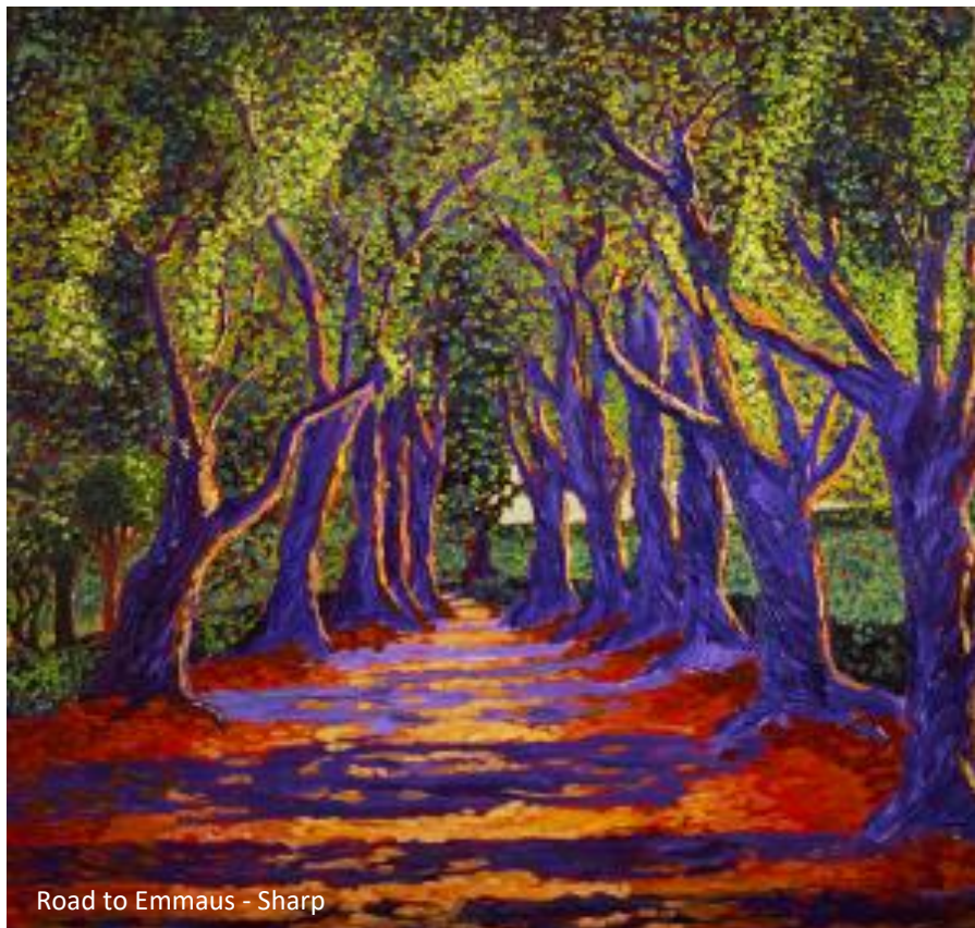
Road to Emmaus - Sharp

Gelovigen weten zich geroepen zich in te zetten voor de opbouw en voortgang van de parochie en de geloofsgemeenschappen. Zij kunnen rekenen op ondersteuning en de mogelijkheid hun talenten te ontwikkelen door scholing, vorming en toerusting. Waar mogelijk zal dit op de werkplek gebeuren en zien de pastores dit als een onderdeel van hun taak. Soms kan het volgen van een cursus of training de meest geschikte weg zijn. Zo mogelijk kan de toerusting in groepsverband in de parochie worden georganiseerd. In andere gevallen wordt een individueel traject gezocht.