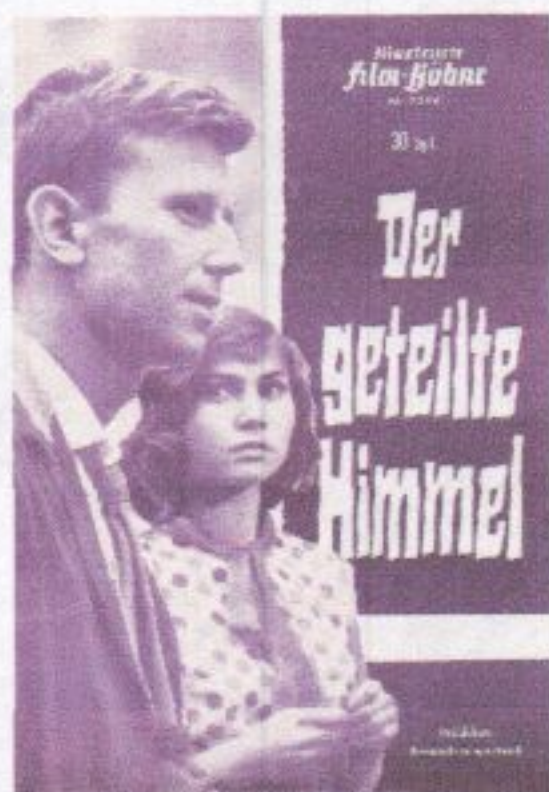
1963 Christa Wolf (tussendoor in de DDR verboden film)