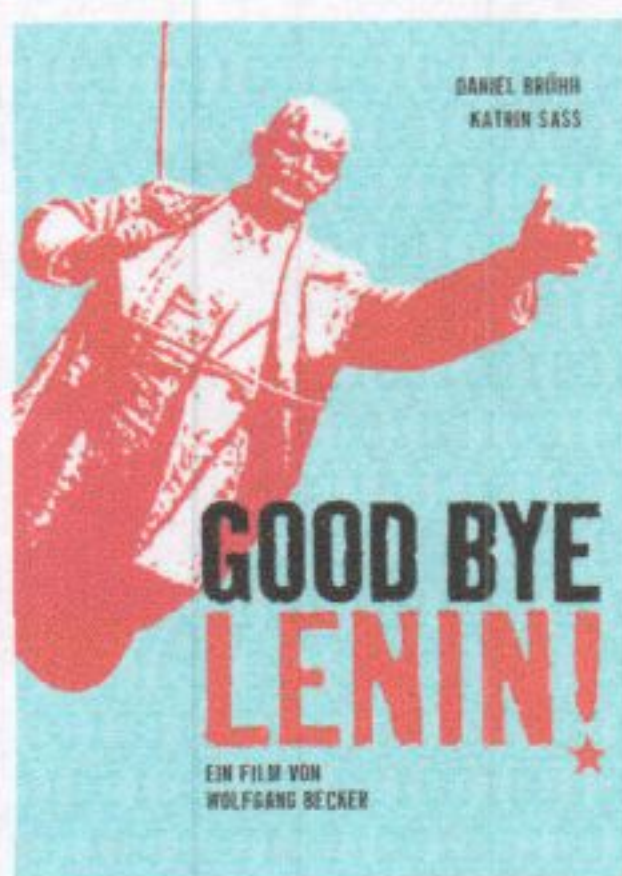
2003 Wolfgang Becker (Westduitser)

Tussen de filmpjes is er tijd om vragen te stellen.