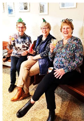
De 'dames van de catering'